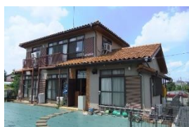
クラブかたつむり

放課後や休日に主にろう学校や特別支援学校に通っているなかまが集まるための学童クラブです