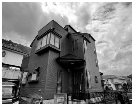
グループホーム畑中たましろ荘

聞こえと併せて他の障害がある「ろう重複者」を対象とした青梅市にある障害者支援施設 (長期・短期入所) とグループホームです。